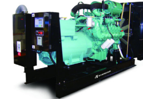
موتور گاز سوز دوسان