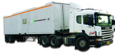
مجموعه دیزل ژنراتور کانتینری